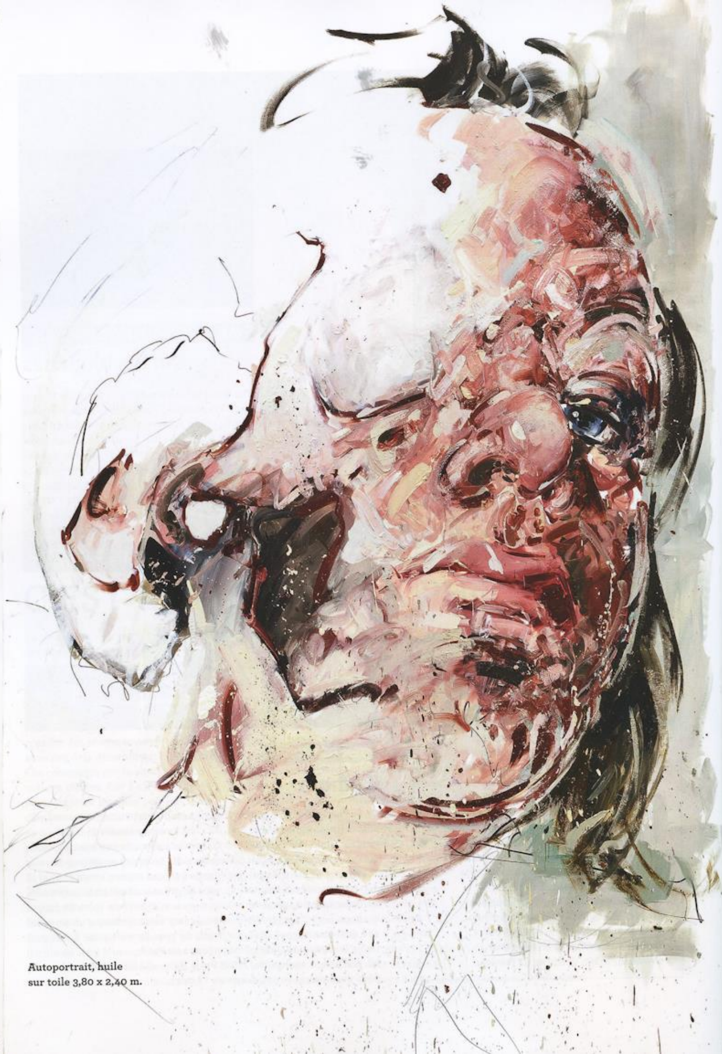
Autoportrait, huile sur toile 3,80 x 2,40 m.