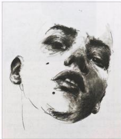
Stella, crayon, 3,20 x 2,10 m.

Jusqu'en juin 2013, exposition Work in Progress au Storage. 38, avenue du Fond de Vaux - Saint-Ouen l'Aumône.